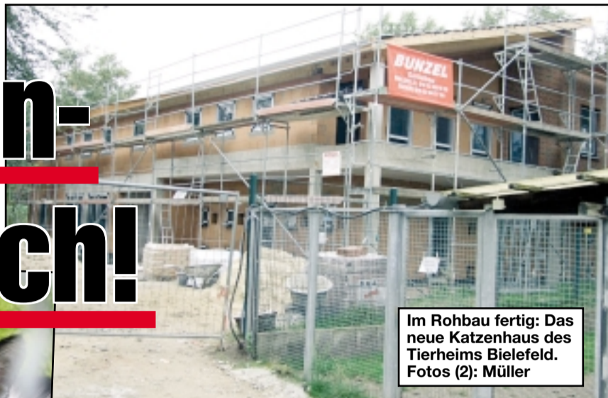
Im Rohbau fertig: Das neue Katzenhaus des Tierheims Bielefeld.

Bielefelder Sebastian Heinisch entwickelte „heißes“ Online-Spiel: